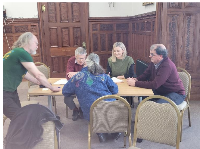
Uchod: Lluniau o'r gweithdai 'Arloesi Gwynedd Wledig' yn ystod Gaeaf 2022-23.